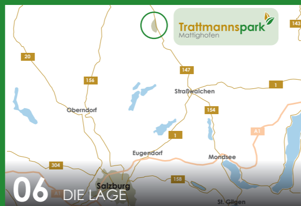
06 DIE LAGE