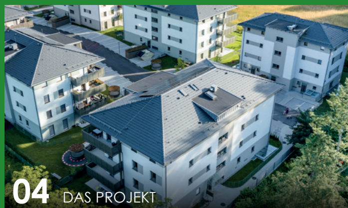
04 DAS PROJEKT