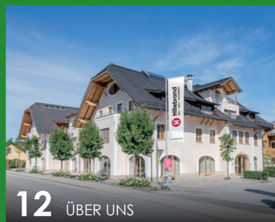
12 ÜBER UNS

Leben und Wohlfühlen im Trattmannspark in Mattighofen. Unweit vom Stadtzentrum steht ein modernes Neubauprojekt mit besonderem Mehrwert.