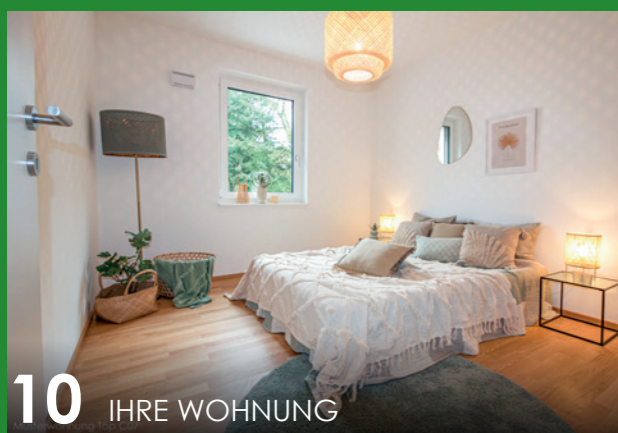
10 IHRE WOHNUNG