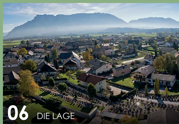
06 DIE LAGE