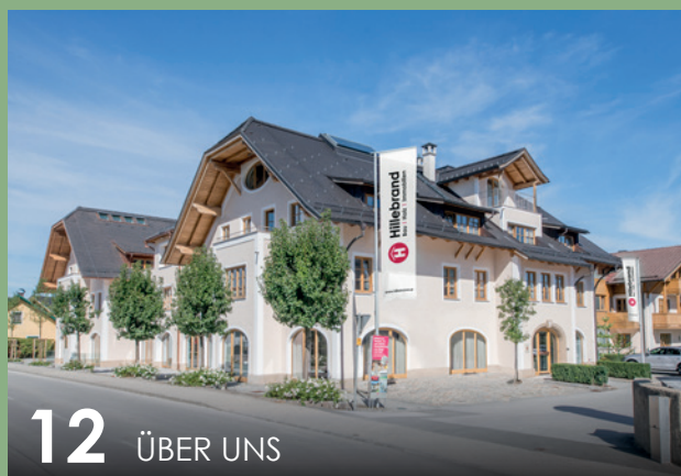
12 ÜBER UNS

Willkommen in Ihrem neuen Zuhause! In unserem Neubauprojekt „Augarten“ entstehen 19 Eigentumswohnungen mit Wohlfühlfaktor für jeden Lebensstil.