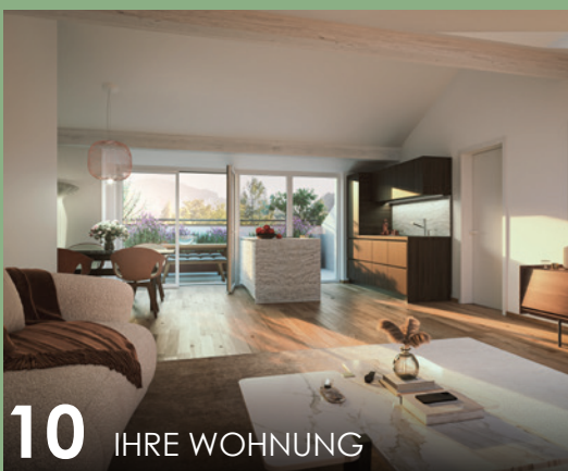
10 IHRE WOHNUNG