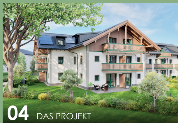
04 DAS PROJEKT