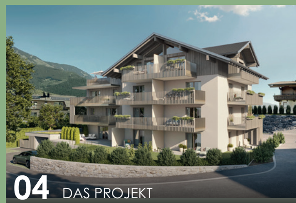
04 DAS PROJEKT