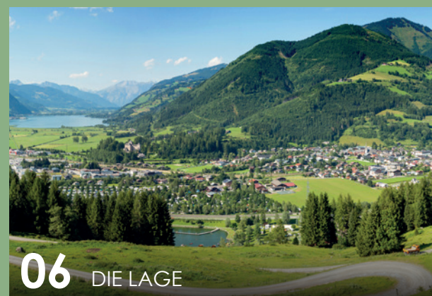
06 DIE LAGE