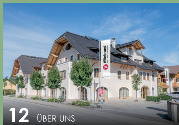
12 ÜBER UNS

Atemberaubende Panoramaaussicht bei unseren 14 Wohnungen mit 2 bis 4 Zimmern. Die wunderschöne Naturlage in Bruck an der Großglocknerstraße bietet den idealen Ausgangspunkt für ein aktives Leben.