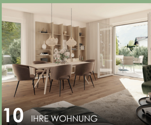
10 IHRE WOHNUNG